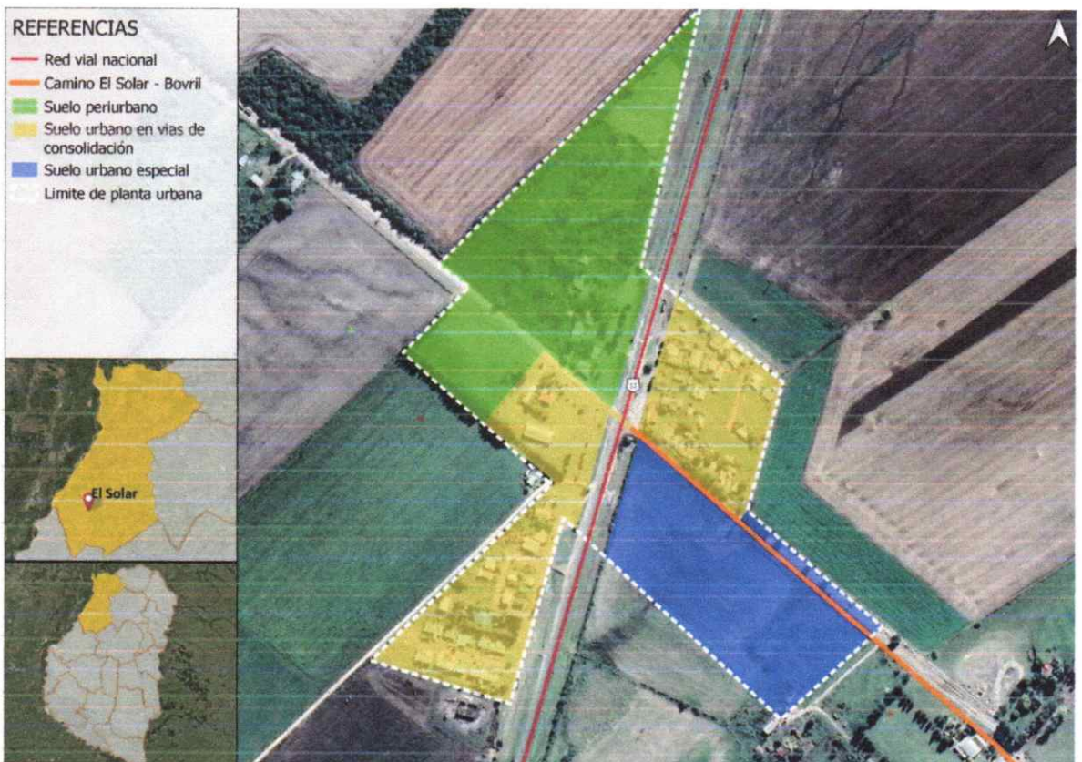
Mapa Usos y límites de Nueva Planta Urbana BERTOZZI.